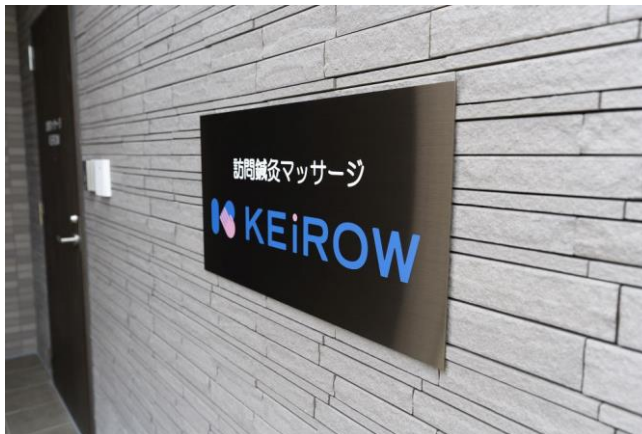
併設の訪問鍼灸マッサージ「KEiROW」直営店

あん摩マッサージ指圧師や鍼灸師など国家資格を持つ施術家によるサービスを提供するKEiROW。ご入居様様が居室で受けられるほか、1階に専用の施術室も整備しています。