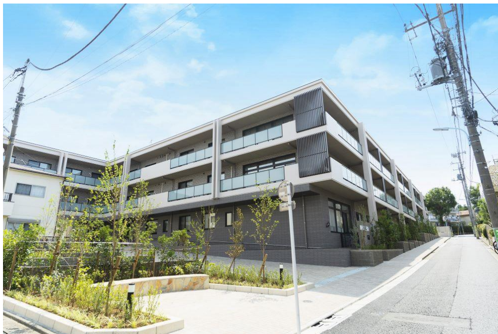
イリーゼ明大前外観

今回オープンした「イリーゼ明大前」は、京王線の明大前駅から徒歩約 10 分という利便性の高い場所に位置しています。イリーゼとしては初めて、1 階から 3 階のフロアごとの特徴を生かして異なる価格帯を設定し、ご入居者のライフスタイルに合わせて居室をお選びいただける造りとなっています。また、当社グループの訪問鍼灸マッサージ「KEiROW」の直営店を併設し、ご自身で出歩くことが難しい方でも、国家資格を持つ施術家による鍼灸やマッサージを居室で受けることが可能です。屋上には太陽光パネルを設置することにより、温室効果ガスを削減し、脱炭素社会の実現に貢献します。