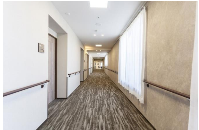
カーペットが敷かれ、シックな空間が広がる3階フロア