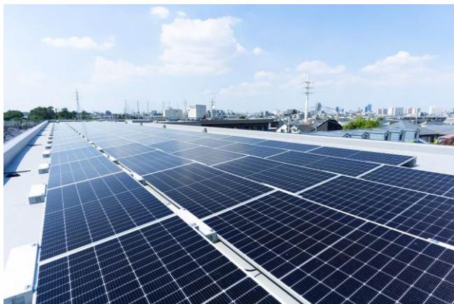
屋上の太陽光パネル