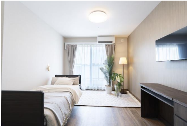
壁掛けの32インチのテレビやデスク、チェストを備え付けられた3階の居室（一例）